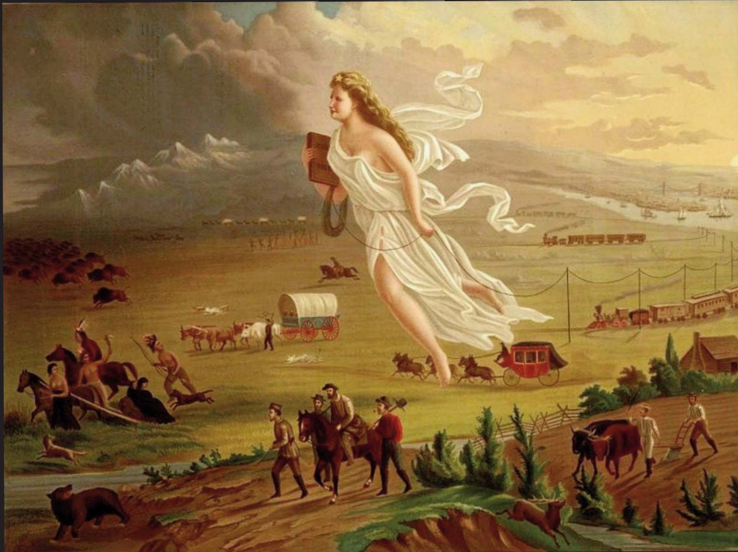
John Gast, American Progress , 1872