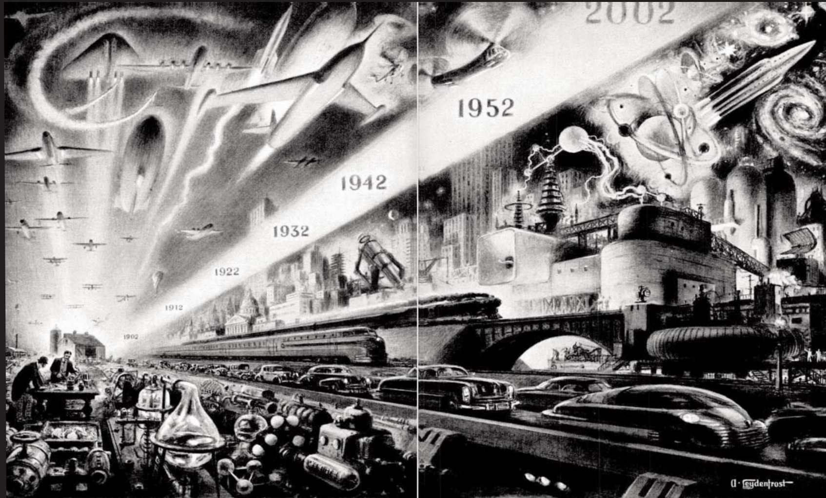
Science on the March, Popular Mechanics , 1952.