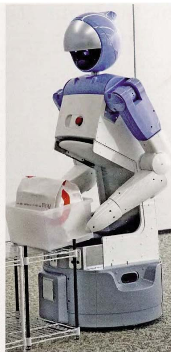
Οι μηχανικοί βρoνόντες του ρομπότ μεταφέρουν το κτίριο και το τοποθετούν στο τρέξιμο. Η χρήση των ρομπότ σε αποθήκες και δίκτυα διανομής προϊόντων διαρκώς επεκτείνεται.

Βέβαια, σε ορισμένες δραστηριότητες είναι αδύνατον να αντικατασταθεί ο άνθρωπος. Ένας από τους τομείς που επί του παρόντος βρισκονται στο απρόβλεπτο είναι αυτός της οικοδομής. Ένα ρομπότ είναι εντελώς άχρηστο στην