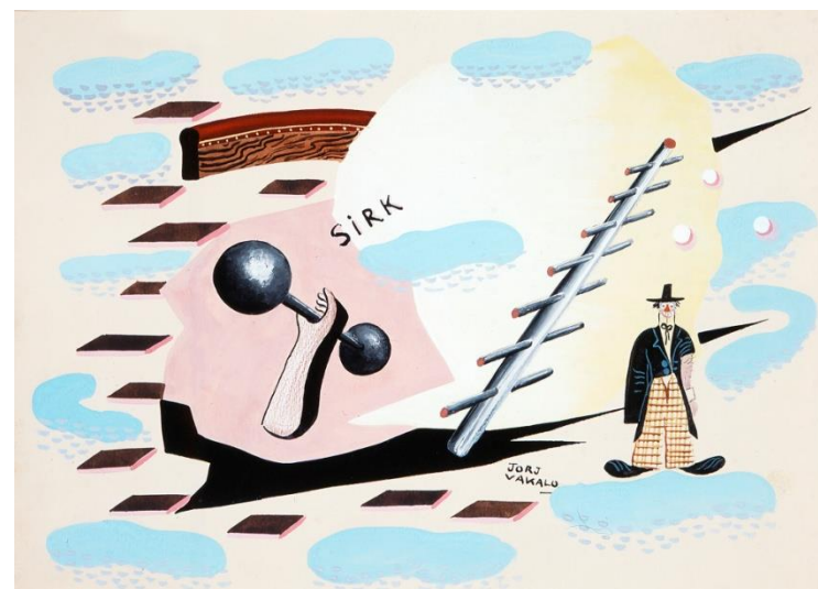
Βακαλό Γ, Ο κλόουν, Εθνική Πινακοθήκη, Copyright.