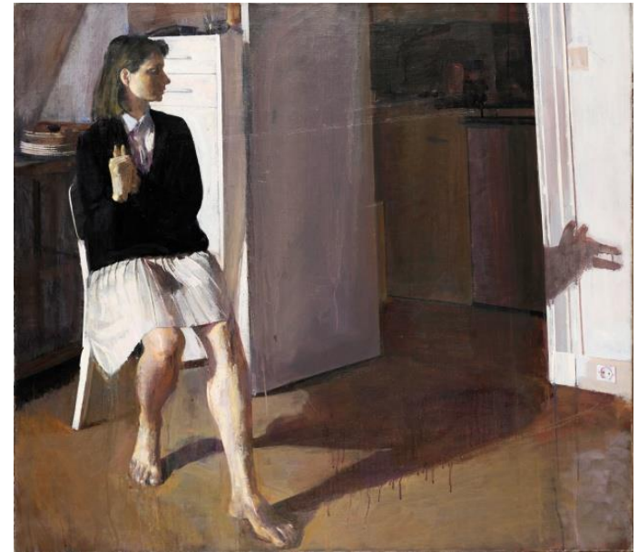
Ρόρρης Γ, Εθνική Πινακοθήκη, Copyright .