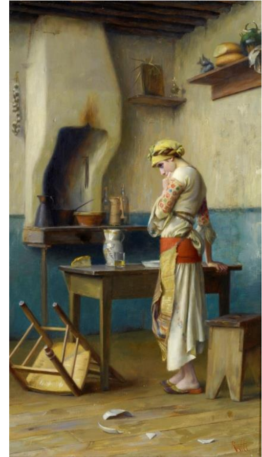
Ράλλης Θ, Ο πρώτος μπάτσος, Εθνική Πινακοθήκη, Copyright.