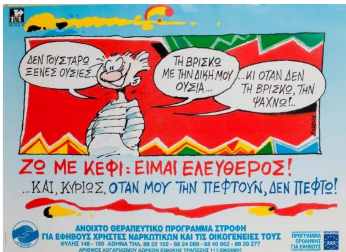
Εικόνα 5.6