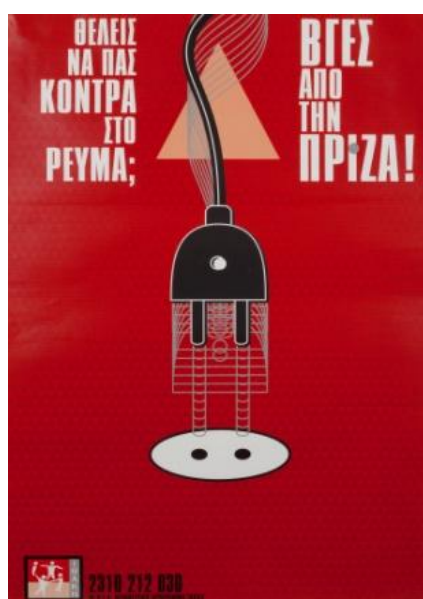
Εικόνα 5.2

Οι ερωτήσεις του ερωτηματολογίου ASSIST ανιχνεύουν κατά πόσο η χρήση ουσιών είναι επικίνδυνη και πιθανά βλαβερή για τον ασθενή στην παρούσα στιγμή ή στο μέλλον. Διακρίνονται επίπεδα μέτριου και υψηλού κινδύνου. Οι ερωτήσεις οι οποίες σχετίζονται με χρήση υψηλού κινδύνου είναι η ερώτηση 3 (καταναγκασμός χρήσης), η ερώτηση 7 (αποτυχημένες απόπειρες να σταματήσει τη χρήση) και η ερώτηση 8 (ενέσιμη χρήση). Η συνολική βαθμολογία υπολογίζεται αθροίζοντας τις επιμέρους βαθμολογίες των ερωτήσεων 2-7. Οι απαντήσεις της ερώτησης 8 δεν υπολογίζονται στη συνολική βαθμολογία.