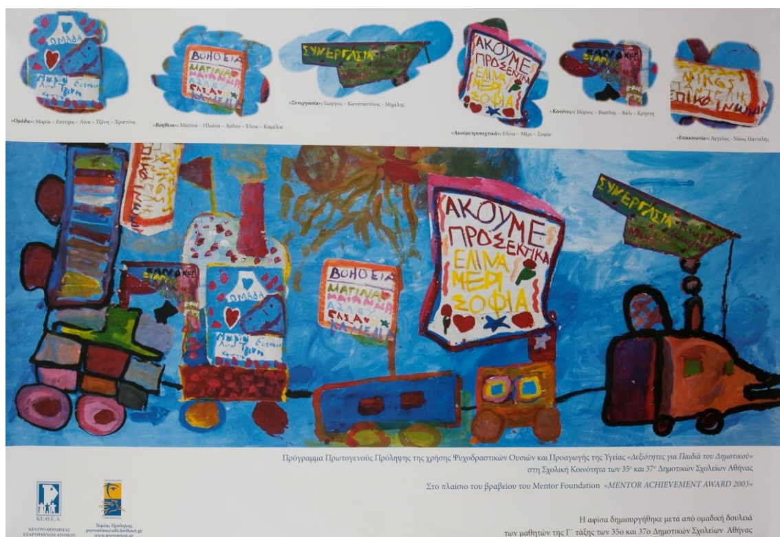
Εικόνα 5.1