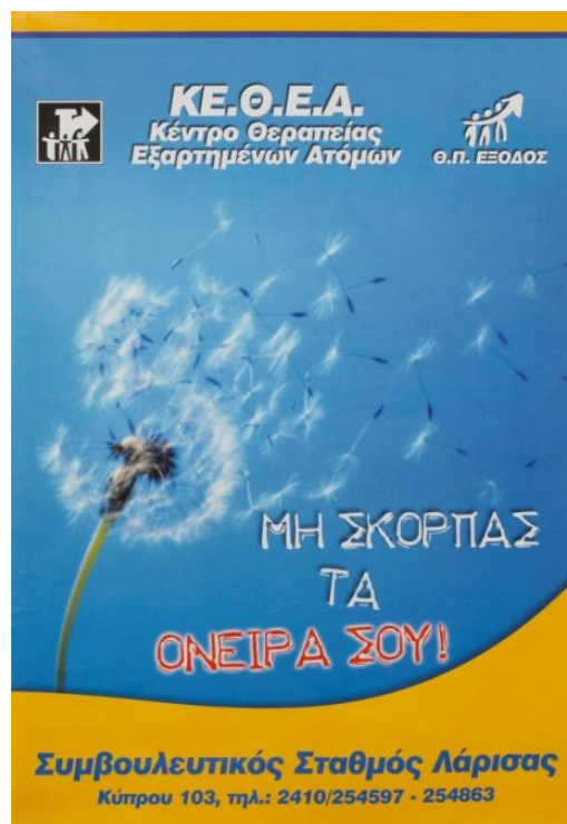
Εικόνα 5.5