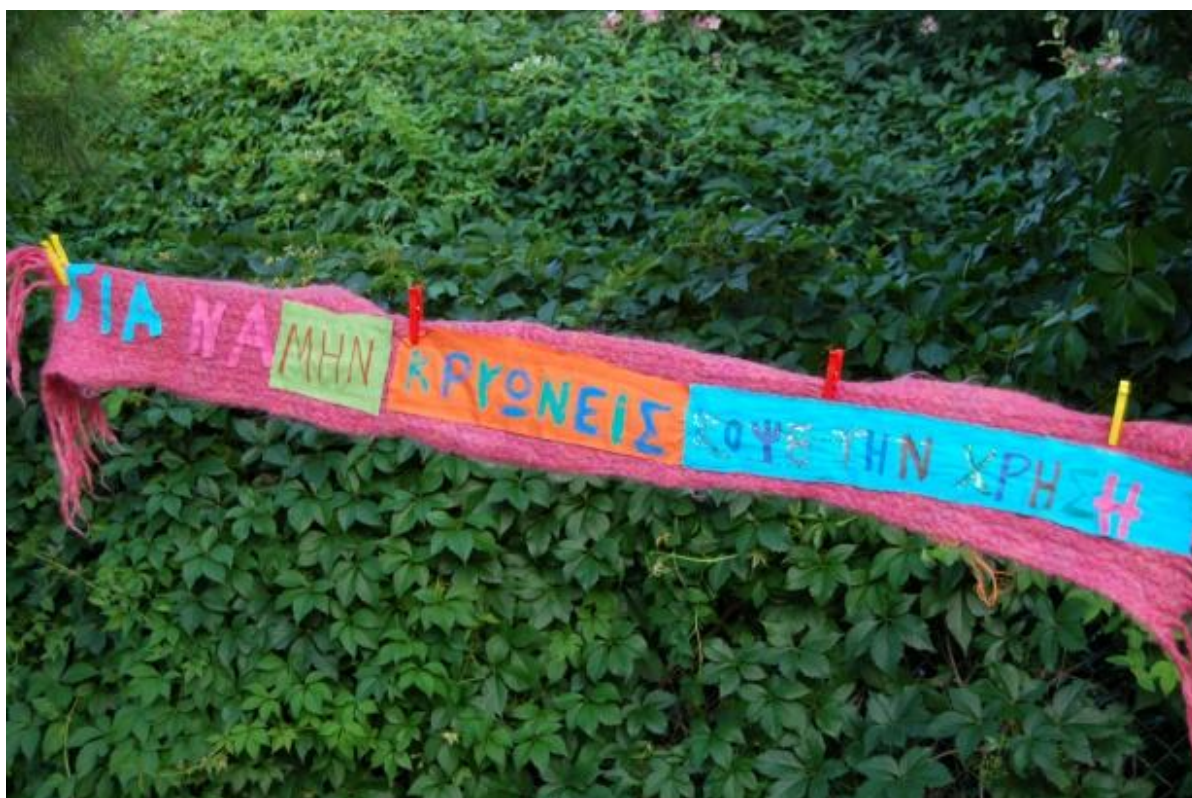
Εικόνα 5.4