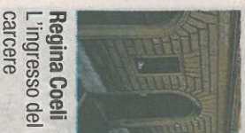
Regina Coeli L'ingresso del carcere

■ È di ieri mattina «la notizia dell'ennesimo episodio incesitoso, subito dal personale di Polizia Penitenziaria, nell'Istituto di Regina Coeli. Nel carcere trasterverino dove c'è sovraffollamento di reclusi, un detenuto straniero di origini centroafricane sottoposto a sorveglianza a vista, dapprima ha minacciato e poi si è avventato contro il personale addetto in qualità di preposto al servizio gettandogli addosso un secchio contenente urina. Il preposto in forte stato di shock è stato portato in ospedale per gli accertamenti del caso. La Pns Cisl esprime piena solidarietà al collega, sottolinea che da tempo lamenta la grave carenza di organico presso l'Istituto di Regina Coeli e critica fortemente l'organizzazione del lavoro».